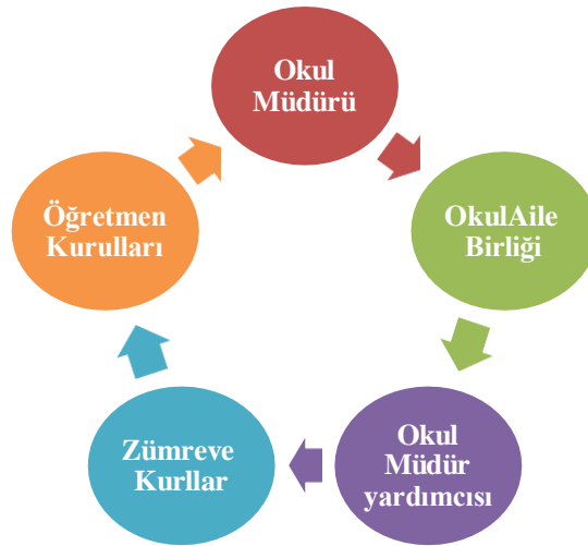
Şekil 1: Paydaş Döngüsü

Paydaş Analizi kapsamında Stratejik Plan Hazırlama Ekibi; okulumuzun sunduğu ürün/hizmetlerinin hangi paydaşlarla ilgili olduğu, paydaşların ürün/hizmetlere ne şekilde etki ettiği ve paydaş beklentilerinin neler olduğu gibi durumları değerlendirerek Paydaş Ürün/Hizmet Matrisi hazırlamıştır.