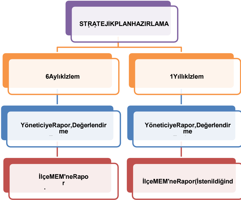
Şekil 2: İzleme ve Değerlendirme Süreci

Müdürlüğümüzün 2024-2028 Stratejik Planı İzleme ve Değerlendirme sürecini ifade eden İzleme ve Değerlendirme Modeli hazırlanmıştır. Okulumuzun Stratejik Plan İzleme-Değerlendirme çalışmaları eğitim-öğretim yılı çalışma takvimi de dikkate alınarak 6 aylık ve 1 yıllık sürelerde gerçekleştirilecektir. 6 aylık sürelerde Okul Müdürüne rapor hazırlanacak ve değerlendirme toplantısı düzenlenecektir. İzleme-değerlendirme raporu, istenildiğinde İlçe Milli Eğitim Müdürlüğüne gönderilecektir.